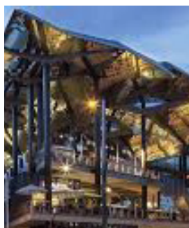
Mercat dels Encants Barcelona