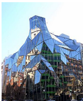
Osakidetza Gobierno Vasco Bilbao