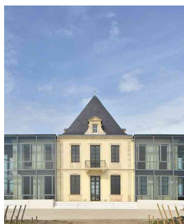
Chateau Pedessclaux Bordeaux