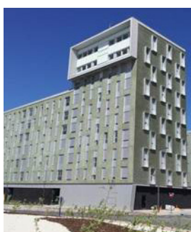
Immeuble Zabalgana Vitoria-Gasteiz