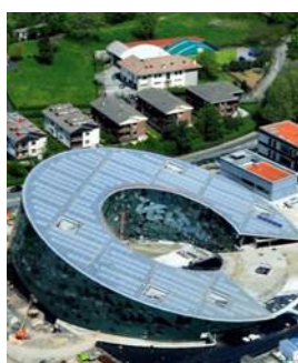
Orona Innovation City Donostia SS