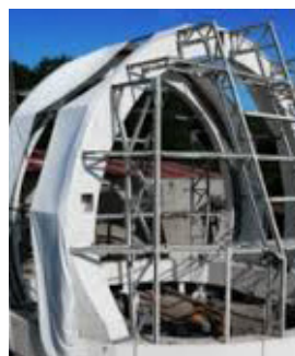
Telescope Solair Basauri