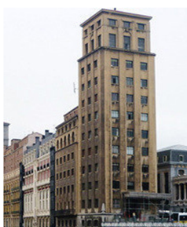
Tour Bailén Bilbao