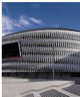
Stade San Mamés Bilbao