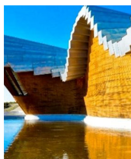
Bodegas Ysios Laguardia