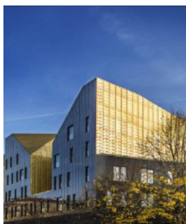
Musikene Donostia SS