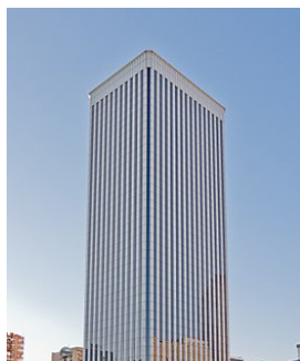
Tour Picasso Madrid