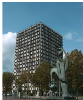
Tour Anoeta Madrid