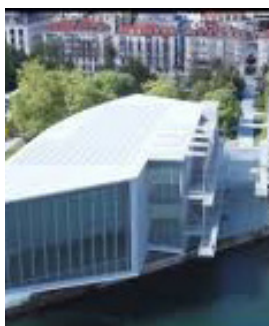
Centre Botín Santander